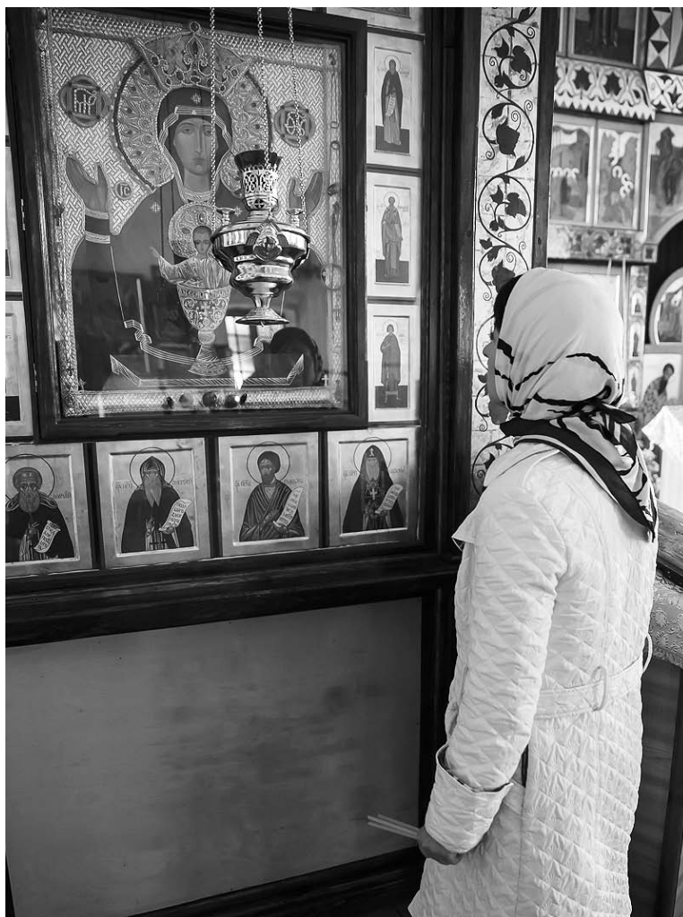
Молитва перед чтимой иконой Божией Матери «Неупиваемая Чаша»

Тут в храм вошел священник, и после благословения, отвечая на наши вопросы, рассказал об обретении святыни, состоянии храма, отношении к нему местных жителей.