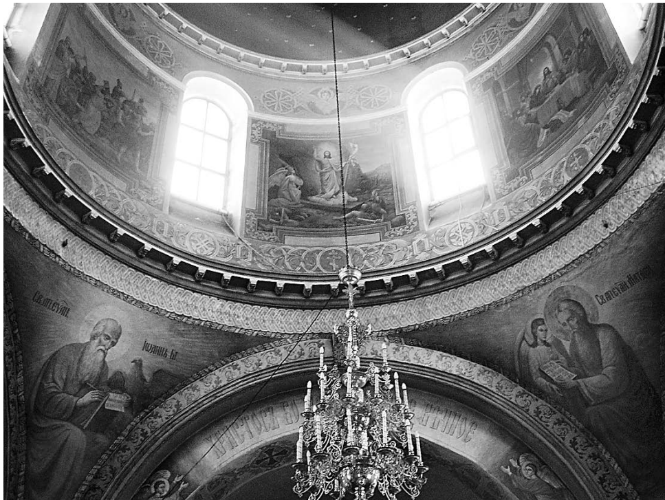
Центральный купол Знаменской церкви села Воскресенского