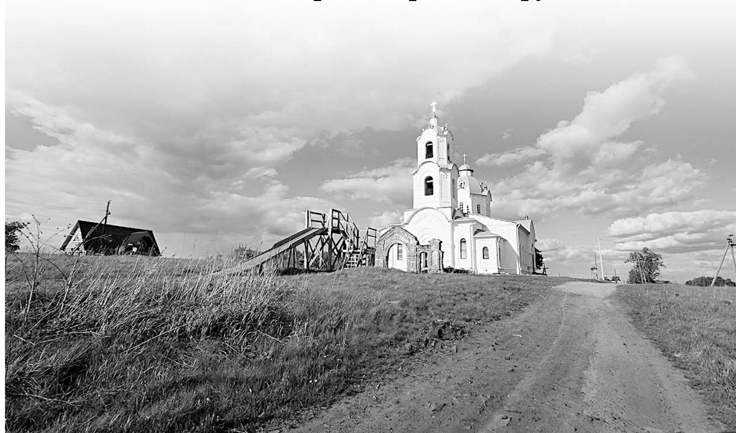
Храм Покрова Божьей Матери, село Булзи

В 1784 году Воскресенское заполучили Демидовы, крестьяне превратились в заводских крепостных, начался период железа и древесного угля. Демидовы владели Кыштымским и Каслинским заводами. Богатейшие были