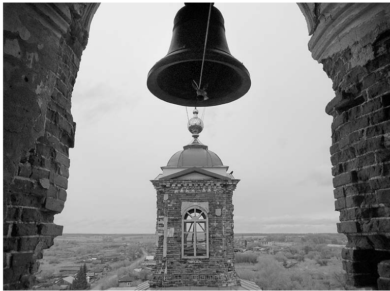
Вид на село Батурино – родовое гнездо Капустиных. Фото В. С. Савелюк, май 2016 г.

Предвидя ход исторических событий, архимандрит «завакуфил» самые священные места, то есть юридически офор-