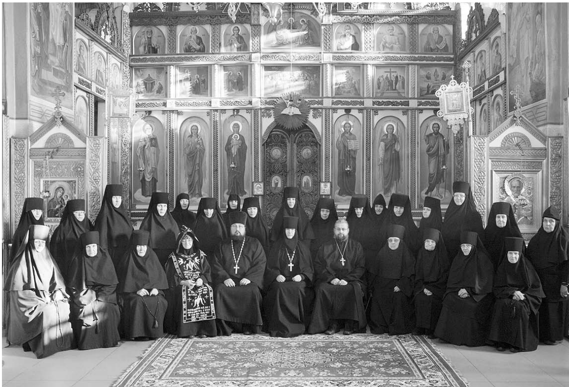
Общее фото всех сестер

в обители мыла разных сортов, хлеба, швейных изделий. Рано утром привозит от местных фермеров молочную продукцию, для чего научилась водить машину. Еще монахиня выезжает в скит (это загородная территория монастыря), чтобы лично посадить морковь, свеклу, сельдерей, и контролирует, как оно всё там растет. Наверняка есть что-то еще, о чем я не знаю. Не представляю, как всё это можно успеть. Наверное, только с Божией помощью.