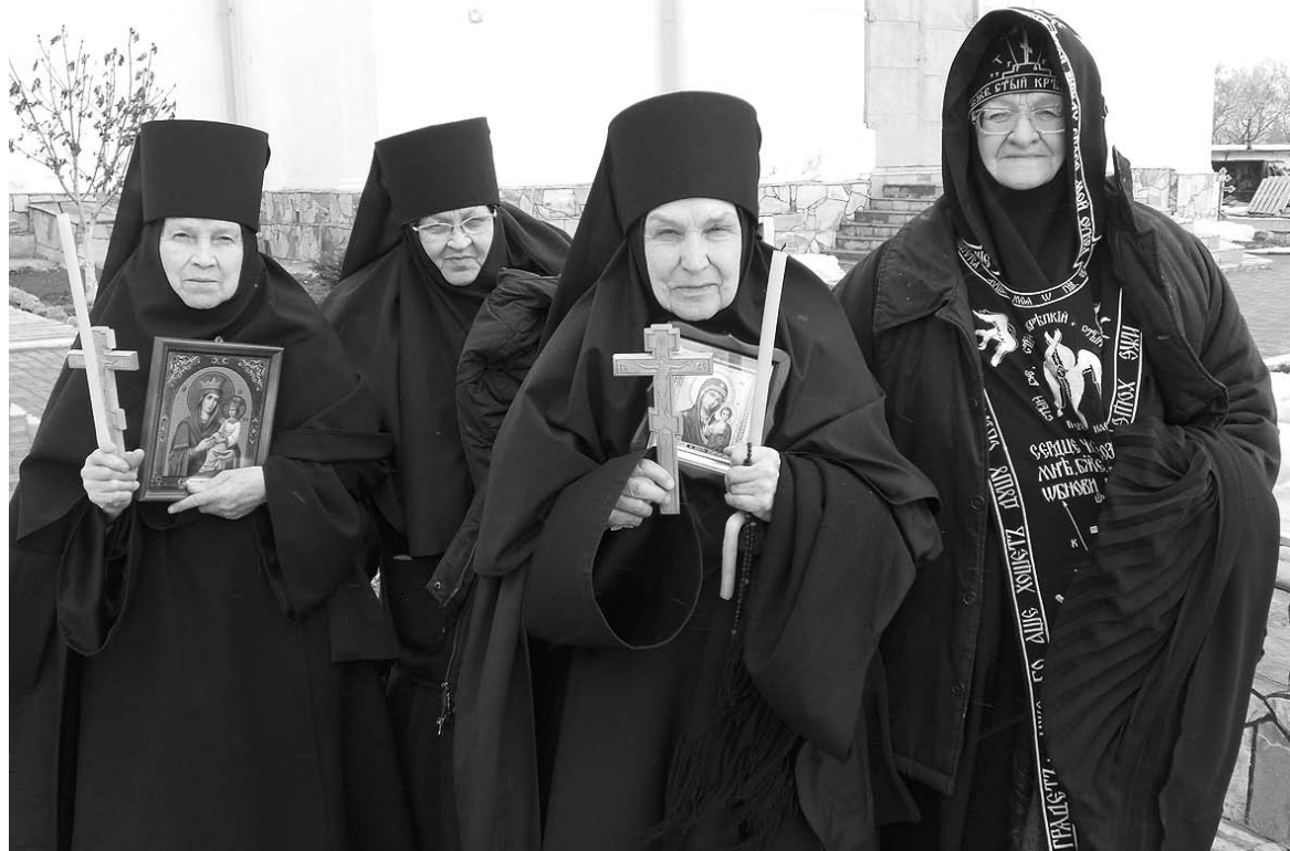
Постриг двух сестер

Постепенно храм заполняют верующие. Ставят свечи, прикладываются к образам. Надо сказать, что в монастыре хранятся мощи 160 святых – настоящая духовная сокровищница! Вот пришли две девушки со свечами. Робко оглядываются по сторонам. В ином храме, чуть заезвешься, к тебе уже подлета-