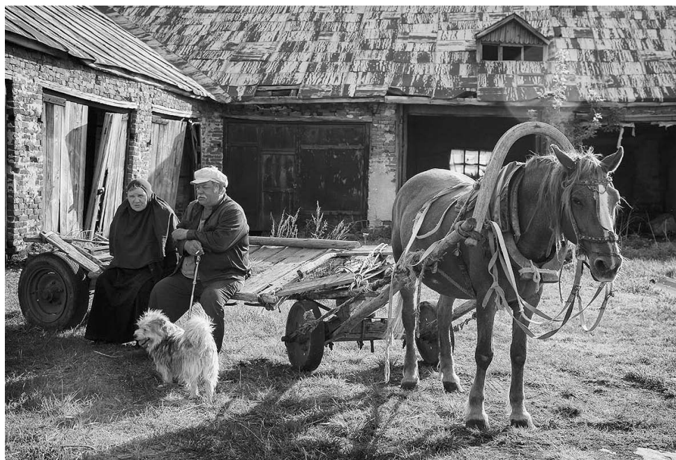
Булзи. Здесь всегда рады гостям

Радует, что храм общими усилиями восстановили. Теперь не повторить бы того, что было раньше. Оберегать и хранить, и передать потомкам.