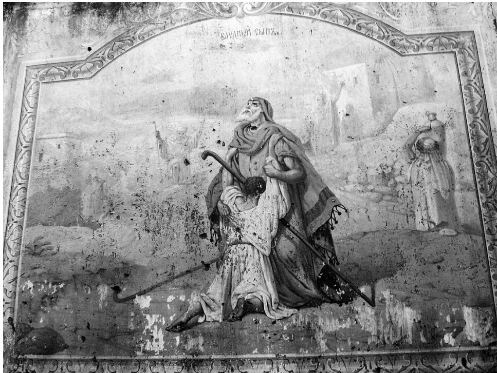
Возвращение блудного сына. Роспись Ильинского храма в Огневском